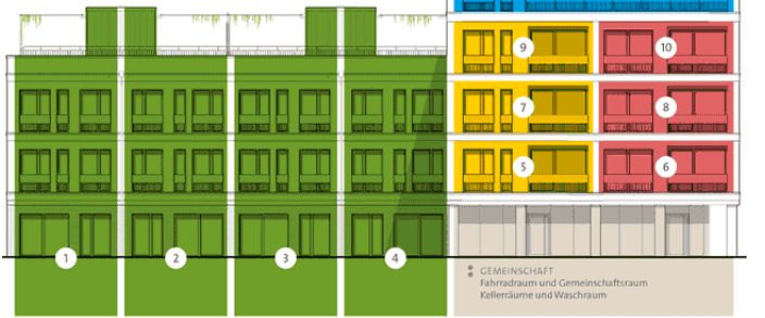
TOWNHOUSES Nr. 1-4